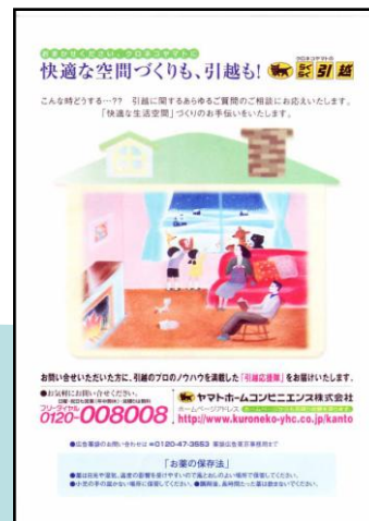
裏面(広告スペース)